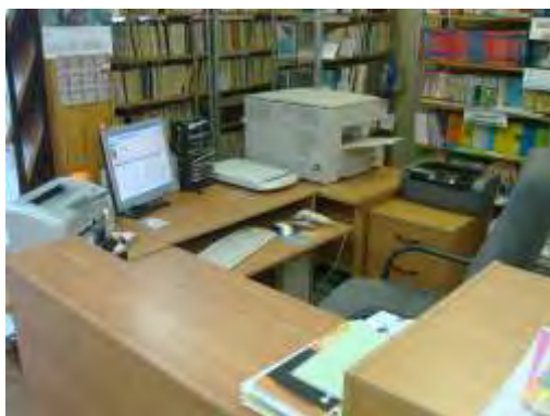
Рабочее место библиотекаря.

Школьная библиотека оснащена автоматизированной библиотечной программой.